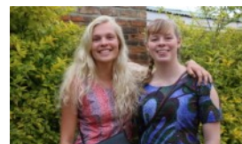
ULEDER-FARVEL HVAD DE LÆRTE OG OPLEVEDE