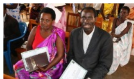
TIMOTHY-PROJEKTET STOLTE DELTAGERE FÅR BIBELPRÆMIE