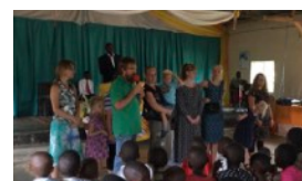
RWANDA-TOUR JOHANSEN FAMILIEN HUSKER TILBAGE