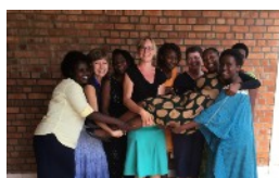
MIT AFRIKA HVERDAGSLIV I RWANDA