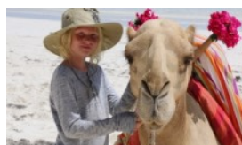
GLÆDELIG JUL OG GODT NYTÅR FRA KENYA